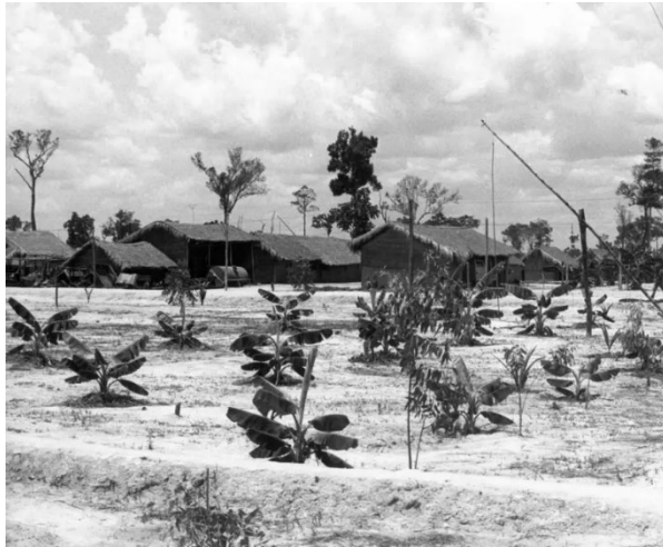
Trại Cải Tạo, Bắc Việt Nam { https://www.bbc.com/vietnamese/articles/ce9vzyd45e1o }