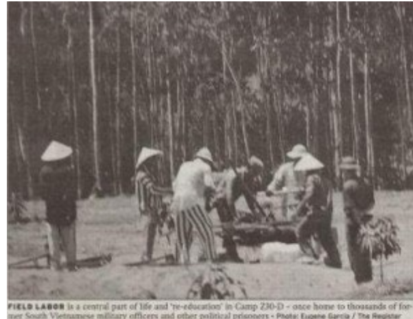
FIELD LABOR is a central part of life and 're-education' in Camp 230-D - once home to thousands of former South Vietnamese military officers and other political prisoners - Photo: Eugene Garcia / The Register Trại Lý Bá Sơ, Bắc Việt Nam { https://hung-viet.org/a25631/viet-ve-cuu-tu-truong-ly-ba-so-trinh-van-thich }

- Hy vọng lâu thì cuối cùng cũng vẫn đến nơi. Loại tàu này đầy trộm cắp và chật chội. Người và vật như heo, chó, gà chung một toa, chồng chất lên nhau, có được chỗ ngồi là đại phúc. Suốt bốn ngày ba đêm, chúng em không dám ngủ, hở một chút là mất cắp, không còn một thứ gì anh ạ. Dầu sao em vẫn còn đỡ cực vì nhỏ tuổi hơn chị Thùy, lại còn phải lo cho cháu. Tội nghiệp thằng bé Khôi, mới 10, 11 tuổi, đi đường xa, cứ dựa vào vai mẹ ngủ gà ngủ gật. Nó cũng không đòi ăn, thỉnh thoảng uống nước, nhưng cháu đáng mặt dòng dõi con nhà binh, không kêu ca, than van một lời. Lúc đó, em nghĩ đến các anh đang bị giam trong tù. Nhìn cháu Khôi và chị Thùy, em thấy xót xa quá.