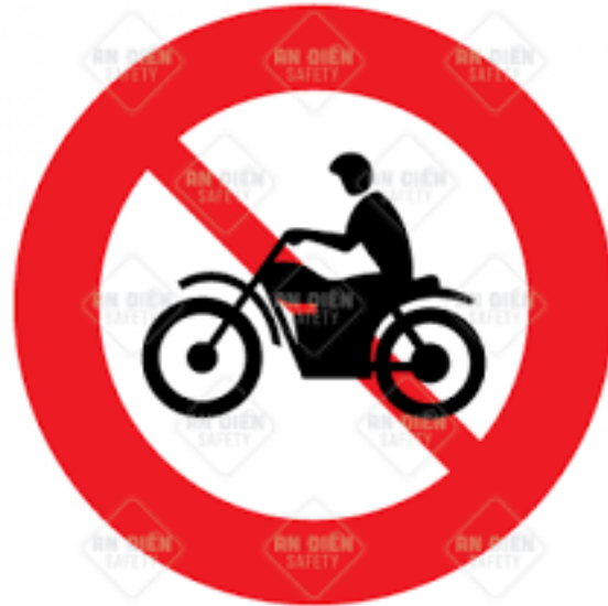
Xe Thò {?}