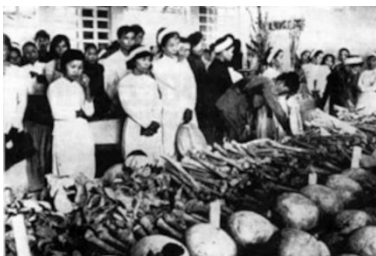
Tết Mậu Thân năm 1968, Cộng Sản Bắc Việt tàn sát tập thể người dân Huế, Việt Nam Cộng Hòa { https://www.rfa.org/vietnamese/in_depth/hue-

Trong suốt cuộc chiến, QLVNCH đã làm cho địch quân nhiều phen khiếp đảm. Trong trận Mậu-Thân 1968, lợi dụng thời gian hưu chiến vào dịp Tết, quân cộng-sản Bắc Việt và Việt Cộng trở mặt bất thần tấn công trên khắp các tỉnh, thành phố và thủ đô Sài Gòn. Mặc dầu bị bất ngờ, QLVNCH đã phản công quyết liệt, các đơn vị Dù, Thủy Quân Lục Chiến (TQLC), Biệt-Động-Quân, Biệt-Kích-Dù đã đập tan mưu mô xảo quyệt của địch, quét sạch quân thù ra khỏi thành phố Sài Gòn. Tại các tỉnh, các sư-đoàn Bộ-Binh, các đơn vị Địa Phương Quân sát cánh cùng với các đơn vị tổng trừ bị đẩy lui quân cộng sản, tái lập sự an-ninh, trật tự trên toàn lãnh thổ miền Nam Việt Nam. Thảm bại trong trận Mậu Thân, quân Việt cộng của Mặt Trận Giải Phóng Miền Nam (MTGPMN) gần như kiệt sức, làm bọn cầm quyền Hà Nội điên đầu phải gửi gấp các đơn vị chính quy Cộng Sản Bắc Việt (CSBV) vào Nam để bổ xung cho các đơn vị Việt Cộng trong miền Nam.