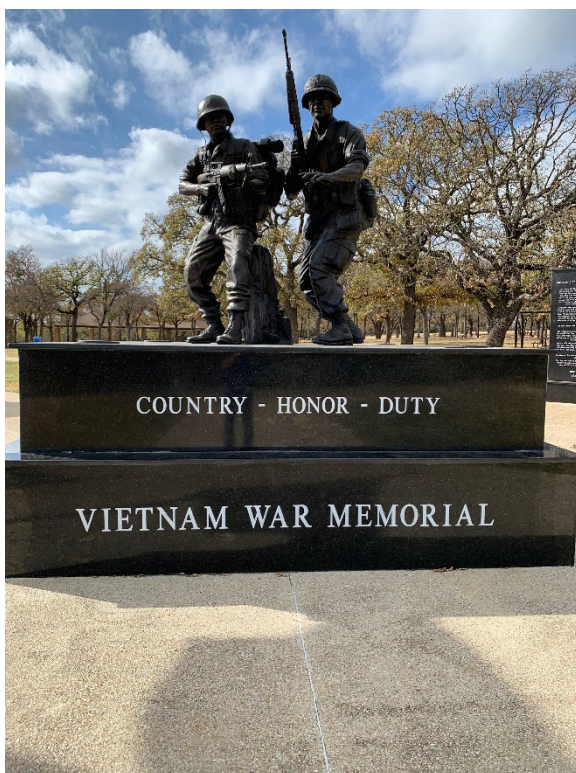
Tượng Đài Chiến Sĩ Việt Mỹ Veterans Park

Để kỷ niệm 61 năm (1965-2026) Ngày Quân Lực Việt Nam Cộng Hòa (VNCH) 19 Tháng 6, đúng 12:00 giờ trưa ngày Chủ Nhật, 14 tháng 6 năm 2026, Liên Hội Cựu Quân Nhân & Hậu Duệ Quân Lực VNCH đã tổ chức một buổi lễ chào cờ và truy điệu tại Tượng Đài Chiến Sĩ Việt Mỹ, trong khuôn viên Veterans Park, thành phố Arlington, tiểu bang Texas, Hoa Kỳ.