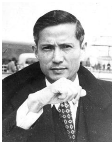
Phan Huy Quát (1908-1979), Thủ Tướng Việt Nam Cộng Hòa { https://en.wikipedia.org/wiki/Phan_Huy_Qu%C3%A1t }