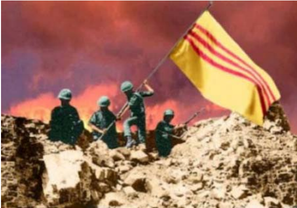
Mùa Hè Đỏ Lửa tại Quảng Trị, Việt Nam Cộng Hòa năm 1972 { https://www.saigonweeklyonline.com/cong-dong/hoang-ngoc-nguyen-mua-he-do-lua-mai-trong-tam-tri.html }