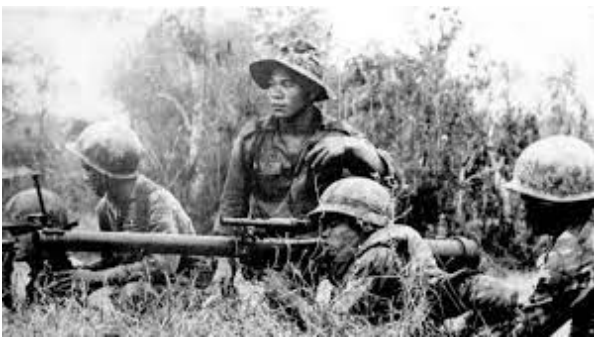
Đèo Chu Pao, Việt Nam Cộng Hòa { https://dongsongcu.wordpress.com/2021/06/28/mua-he-do-lua-nam-1972-mat-tran-kontum-giai-toa-deo-chu-pao-17-km-bac-pleiku/ }