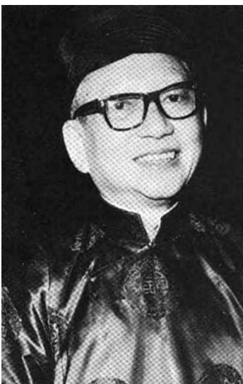
Phan Khắc Sửu (1893-1970), Quốc Trưởng Việt Nam Cộng Hòa { https://en.wikipedia.org/wiki

Ngày 11/06/1965, Quốc Trưởng Việt Nam Cộng Hòa, Ông Phan Khắc Sửu, Thủ Tướng Chính Phủ, Ông Phan Huy Quát, và Chủ Tịch Hội Đồng Lập Pháp, Ông Phạm Xuân Chiểu, đã long trọng chuyển giao trách nhiệm và quyền lãnh đạo Quốc Gia cho Quân Đội.