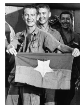
Lá Cờ Mặt Trận Giải Phóng Miền Nam (MTGPMN)