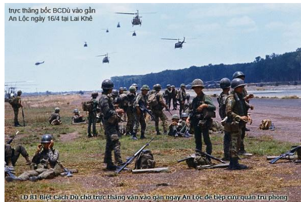
Năm 1972, trận đánh tại An Lộc, tỉnh Bình Long, Việt Nam Cộng Hòa { https://hung-viet.org/a22499/tran-danh-an-loc-mua-he-nam-1972-3 }

Ngày 28 tháng 3 năm 1973, hiệp-định đình chiến Paris ra đời do những chuyến đi đêm giữa Henry Kissinger và Lê-Đức-Thọ. Miền Nam Việt-Nam bị bỏ rơi để đổi lấy số tù binh Hoa-Kỳ bị giam ở Hà-Nội và cũng để gỡ-gạc cho sĩ-diện của người Hoa-Kỳ về chiến tranh tại Việt-Nam. Trong khi những người dân yêu chuộng tự do của miền Nam vẫn còn được sống an-lành trong hai năm cuối (1973-1975). Những chiến-sĩ QLVNCH mới thực sự là nạn nhân của ‘giải-pháp Hòa-Bình’ mà Henry Kissinger/Lê-Đức-Thọ làm đạo diễn. Người lính VNCH đã phải chiến đấu trong một hoàn