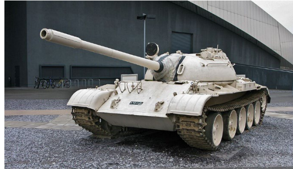
T-54 { https://en.wikipedia.org/wiki/T-54/T-55 }