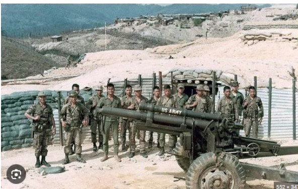
Tiểu-Đoàn 88 Biệt Động Quân Biên Phòng, Quân Lực Việt Nam Cộng Hòa { https://bencublog.wordpress.com/2019/01/16/tieu-doan-88-biet-dong-quan-va-tran-danh-tai-dak-pek-vu-dinh-hieu/ }

Toán có tôi đi vùng I trước, toán khác may mắn hơn được thực tập ở vùng III, toán nào xui phải lên trên vùng cao nguyên (vùng II), và còn xui hơn nữa nếu phải đi căn cứ Dak Pek, nơi đóng quân của tiểu-đoàn 88 BDQ Biên Phòng. Căn cứ này nằm gần biên giới Lào Việt, bộ chỉ huy muốn gửi sĩ quan ra để thực tập kỹ thuật trinh sát, viễn thám. Đến khoảng cuối năm 1973, địch đã cô lập căn cứ Dak Pek và đè nặng áp lực xung quanh căn cứ, mọi việc tàn thương, tiếp tế đều phải xin không trợ. Lúc đó tôi đã về làm việc trong trung tâm hành quân của liên đoàn 22/BDQ, tiểu đoàn 88 trực thuộc liên đoàn. Khi có một toán sĩ quan về thực tập, vị liên đoàn trưởng giữ mấy ông “quan nhỏ” lại, cho thực tập với hai tiểu đoàn còn lại của liên đoàn chứ không đưa lên Dak Pek. Đây là một quyết định rất tốt của cấp chỉ huy, tình hình đang nghiêm trọng đưa mấy ông “bơ sữa” lên trên đó rủi có chuyện gì “vỡ mặt” làm sao kéo họ về kịp, uống cho chương trình huấn luyện. Chưa được làm trung đội trưởng đã ... đi luôn.