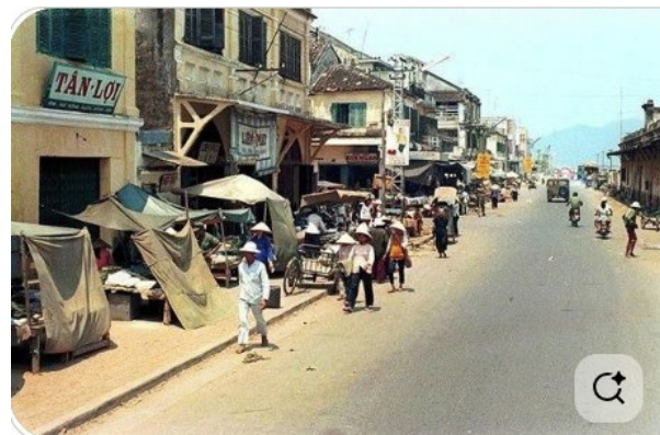
Đà Nẵng, Việt Nam Cộng Hòa

Một điều rất tốt nữa về cấp chỉ huy của tôi là trong suốt thời gian phục vụ trong liên đoàn, tôi chưa hề nghe ông ta chửi thề, đấm sĩ quan trẻ như tôi ông gọi “các cậu, các chú”.