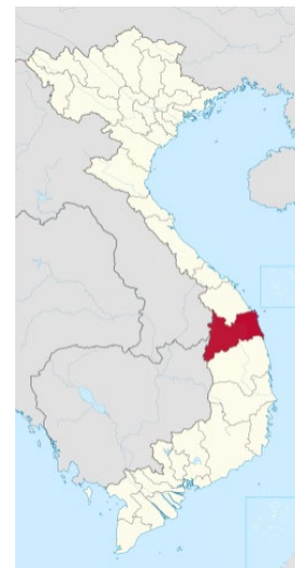
Tỉnh Quảng Ngãi, Việt Nam Cộng Hòa { https://en.wikipedia.org/wiki/Qu%E1%BA%A3ng_Ng%C3%A3i_province }