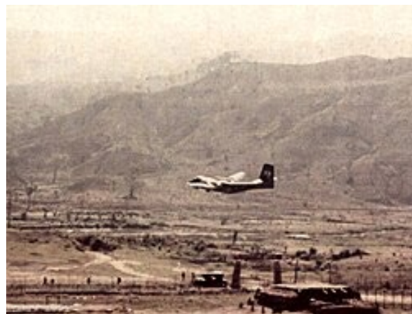
Căn cứ Dak Pek, Vùng II Chiến Thuật, Tiểu-Đoàn 88 Biệt Động Quân Biên Phòng, Quân Lực Việt Nam Cộng Hòa { https://en.wikipedia.org/wiki/Dak_Pek_Camp }