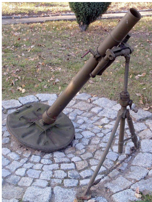
Súng cối 81 ly { https://en.wikipedia.org/wiki/82-BM-37 }