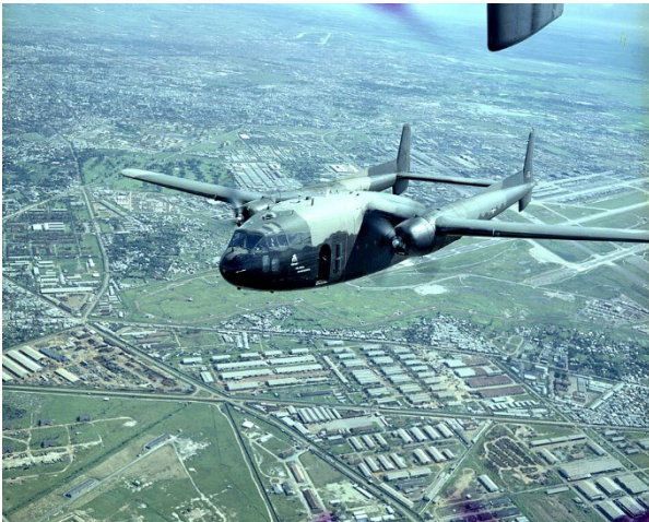
AC-119, Không Quân Việt Nam Cộng Hòa { https://en.wikipedia.org/wiki/Fairchild_AC-119 }

Áp lực địch vẫn đè nặng lên hai tiểu đoàn 84 và 87 BĐQ. Sáng ngày 30 tháng Tư, một chiếc AC-119, không biết từ đâu bay ngang đầu LĐ 8/BĐQ định đáp xuống phi trường Tân Sơn Nhất. Một hỏa tiễn SA-7 của địch bắn lên, chiếc hỏa tiễn tăng tốc độ đuổi theo máy bay, trúng vào đuôi bên phải, nhiều mảnh vụn bắn tung ra. Tội nghiệp chiếc máy bay nghiêng đi, chúi xuống, rồi người phi công cố lái cho phi cơ ngóc đầu lên. Anh em binh sĩ vỗ tay, reo mừng “Lên đi con... Lên đi con...”. Chiếc máy bay cố ngóc đầu lên lần cuối rồi đâm đầu xuống đất.