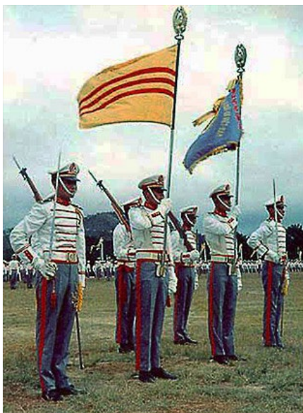
Trường Võ Bị Quốc Gia Việt Nam tại Đà Lạt, Quân Lực Việt Nam Cộng Hòa { https://tvbqgvn.org/ }