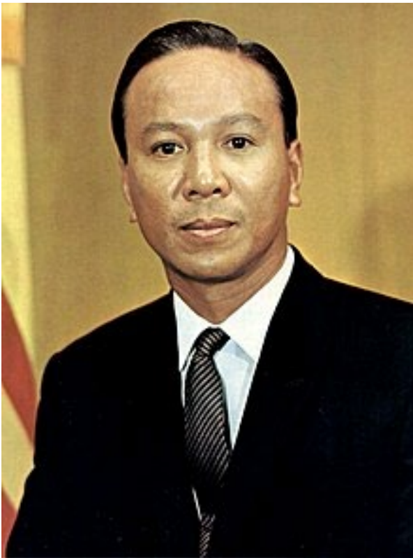
Nguyễn Văn Thiệu (1923-2001), Tổng Thống Việt Nam Cộng Hòa (1967-1975) { https://en.wikipedia.org/wiki/Nguy%E1%BB%85n_V%C4%83n_Thi%E1%BB%87u }

Vào đầu năm 1975, tình hình chính trị tại Sài Gòn thật là rối ren, nhiều đảng phái, phe nhóm muốn lật đổ chính phủ của Tổng Thống Nguyễn Văn Thiệu. Phe nào cũng nghĩ mình có thể tìm ra giải pháp êm đẹp cho miền Nam Việt Nam. Sau hai tháng nằm ở Sài Gòn, các đại đội Trinh Sát BĐQ được trả về cho các liên đoàn BĐQ (mỗi liên đoàn có một Đại Đội Trinh Sát).