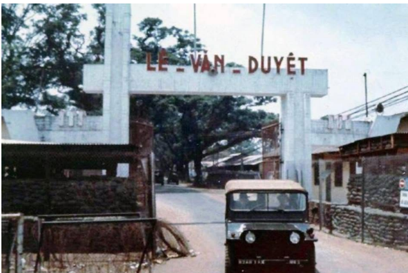
Biệt Khu Thủ Đô, Trại Lê Văn Duyệt, Sài Gòn, Việt Nam Cộng Hòa