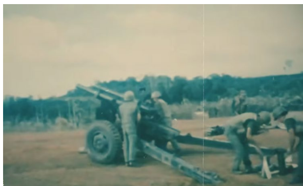
Đại bác 105 ly, Quân Lực Việt Nam Cộng Hòa { https://www.youtube.com/watch?v=HjOCiv2jZUg }

Trung Tá liên đoàn trưởng ra lệnh cho tôi chuẩn bị rút về Sài Gòn. Sau khi TĐ 87/BĐQ rút ngang qua, BCH/LĐ sẽ theo sau và TĐ 86/BĐQ của tôi sẽ đi đoạn hậu. Tôi gọi đại đội đóng ở gần tiểu đoàn nhất, đem đại đội lên chặn địch trên đường Bà Hom. Viên Trung Úy đại đội trưởng dắt theo người vợ mặc áo dài trắng, đi guốc cao gót lên trình diện tôi. Tôi vô cùng ngạc nhiên bảo “Hôm qua, tôi đã ra lệnh cho tất cả gia đình phải rời đơn vị, tại sao chị còn đây!”. Người sĩ quan thuộc cấp trả lời rằng vợ anh ta mới đến sáng hôm nay (đến nay tôi vẫn chưa nhớ được tên của người sĩ quan dẫn em... đó cũng là điều ân hận). Ông ta muốn “gửi nhờ” cô vợ đi theo BCH/TĐ trước khi dẫn quân ra phòng tuyến. Tôi trả lời cho biết, liên đoàn sắp sửa rút lui nên không thể được. Nhìn hai vợ chồng dắt nhau đi mà lòng tôi vô cùng áy náy. Chiếc áo dài trắng và đôi guốc cao gót khập khễnh đi theo đoàn quân. Cho đến giờ tôi không biết số phận của hai vợ chồng ra sao vì sau đó mất liên lạc vô tuyến.