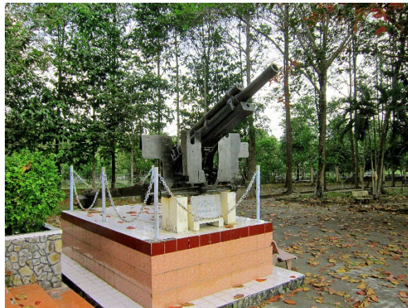
105 ly

Trước khi Đại Tá Hùng rời liên đoàn, ông đã cùng chúng tôi phác họa kế hoạch rút lui vào bên trong thành phố Sài Gòn khi cần thiết. Ba đường rút lui trong kế hoạch được đặt tên Alpha, Bravo và Charlie. Tình hình biến đổi từng giờ, nhưng kế hoạch phòng thủ của LĐ 8/BĐQ vẫn không thay đổi, phân tán mỏng để tránh pháo binh của địch.