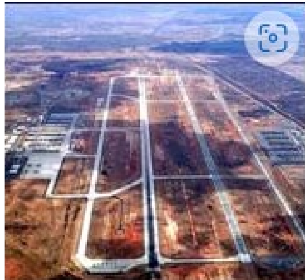
Phi Trường Phan Rang, Việt Nam Cộng Hòa { http://nhaydu.com/index_83hg_files/left_files/MatTranPhanRang.htm }

Liên đoàn 8 BĐQ vẫn làm nhiệm vụ hàng ngày, tảo thanh các đơn vị du kích địch trong vùng trách nhiệm và làm công tác “dân sự vụ”. Đến đêm, tung các toán phục kích ra để ngăn chặn du kích mò về, đặt súng pháo kích vào Sài Gòn. Tuy nhiên, đến tháng Ba 1975, tình hình chiến sự, càng ngày càng bết, hết tỉnh này đến tỉnh khác lọt vào tay địch. Đến khi phòng tuyến Phan Rang thất thủ, Sài Gòn bắt đầu rung động, dân chúng bắt đầu tìm đường đi ra khỏi nước. Công chức, quân nhân đã có nhiều người rời bỏ nhiệm sở.