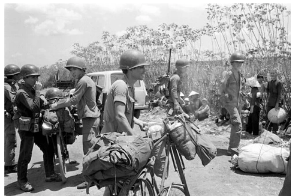
{ https://bienxua.wordpress.com/2024/05/05/nhung-tran-danh-quyet-liet-tren-vong-dai-phong-thu-sai-gon-tran-giao-chien-ngan-chan-cs-qua-cau-tan-cang-28-thang-4-75/ }