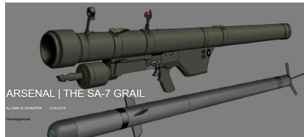
Hỏa Tiễn SA-7