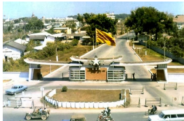
Bộ Tổng Tham Mưu Quân Lực Việt Nam Cộng Hòa, Sài Gòn, Việt Nam Cộng Hòa

Khi liên đoàn rời Dục Mỹ, đã có thêm trách nhiệm đem về Sài Gòn 15 đại đội (ĐĐ) trinh sát của các liên đoàn BĐQ. Các đại đội Trinh Sát BĐQ này đã thụ huấn xong khóa huấn luyện “Tác chiến trong thành phố”, về Sài Gòn, ém quân (giữ bí mật). Liên đoàn 8/BĐQ được tăng cường (quyền xử dụng) 4 đại đội trinh sát, các đại đội còn lại được phối trí trong bộ chỉ huy Biệt Động Quân, Biệt Khu Thủ Đô và trong Bộ Tổng Tham Mưu.