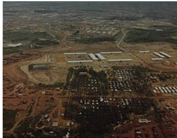
Căn Cứ Long Bình, Việt Nam Cộng Hòa { https://vi.wikipedia.org/wiki/T%E1%BB%95ng_kho_Long_B%C3%ACnh }