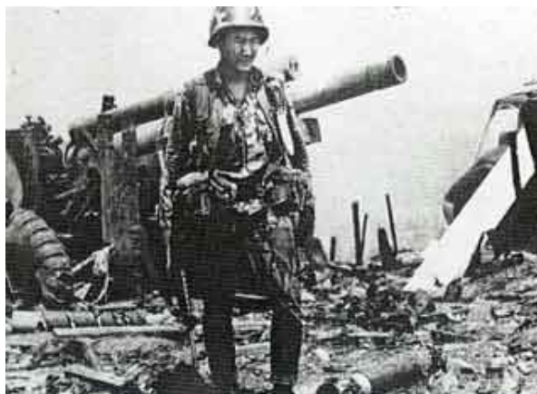
BĐQ trong giờ thứ 25!

Colt 45 { https://nextgun.ch/en/wiki/colt-45-a-timeless-gun-classic/ }